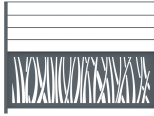
Réf. 170.26-IND C Garde-corps Graphique IND C