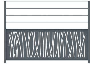
Réf. 170.26-IND B Garde-corps Graphique IND B